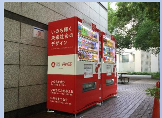
大阪・関西万博支援自販機第1号機