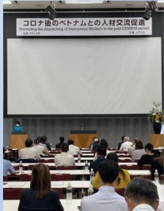
9月8日(木) 於 会議室1001~2