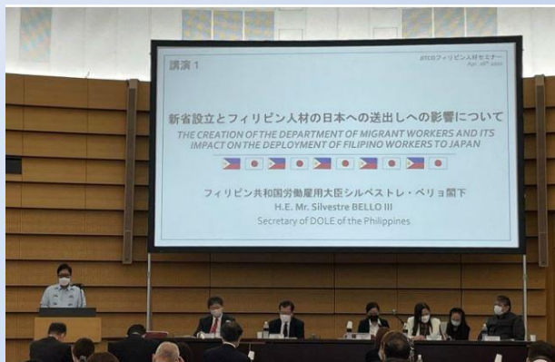
4月26日(火) 於 特別会議場